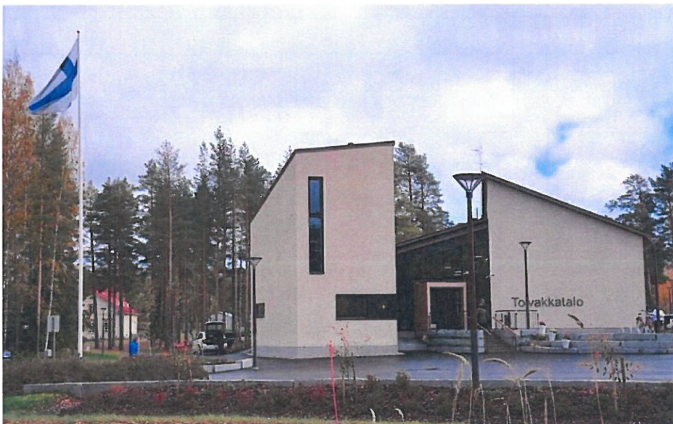
"Toivakkatalo" Toivakan kunnan kuvamateriaalia.