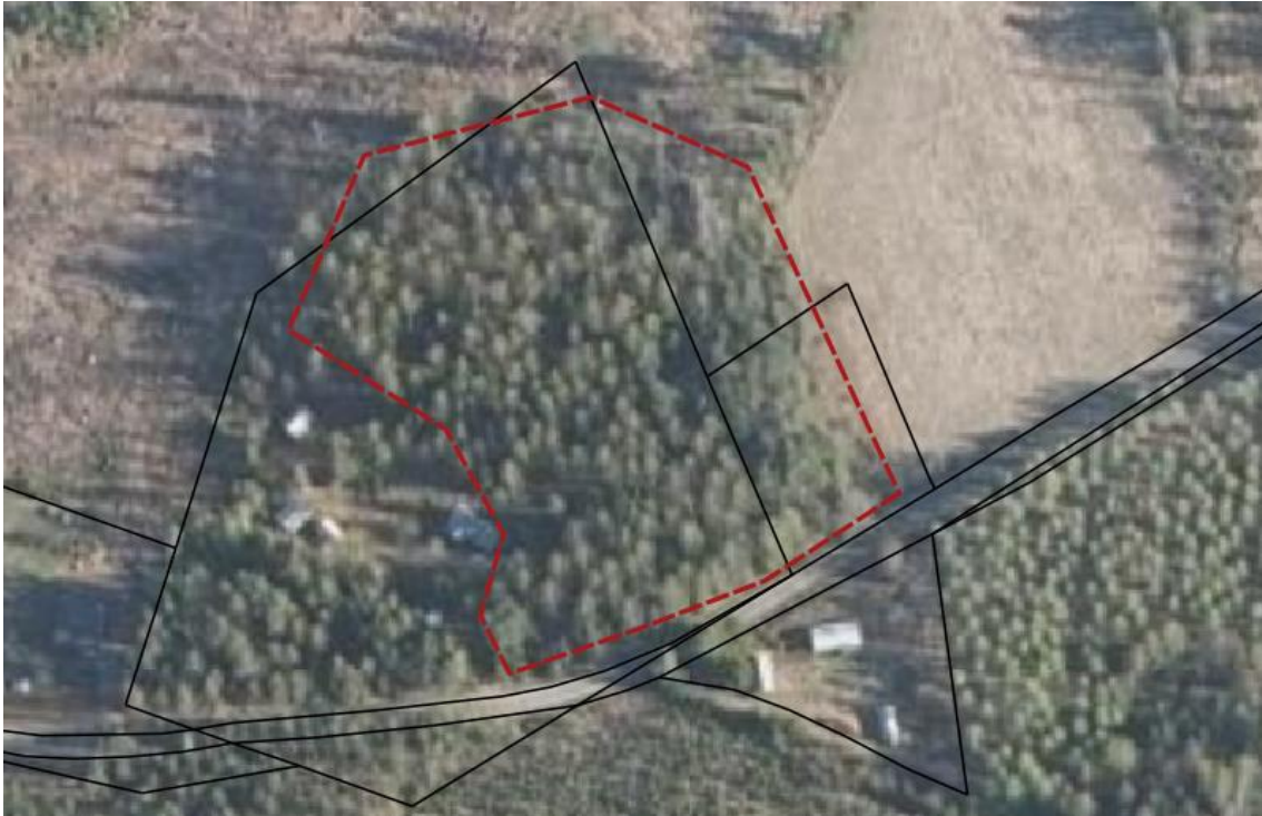
Kuva 1. Kaavamerkinnän rajaus ja nyt selvitetty alue punaisella rajauksella. Kiinteistörajat on esitetty mustalla.

Selvitysalueelle selvityskäynti 16.4.2021. Koko aluerajaus (kuva 1) kuljettiin läpi jalan. Selvitysajankohta oli kevään kulun johdosta optimaalinen liito-oravan papanoiden löytymiselle.