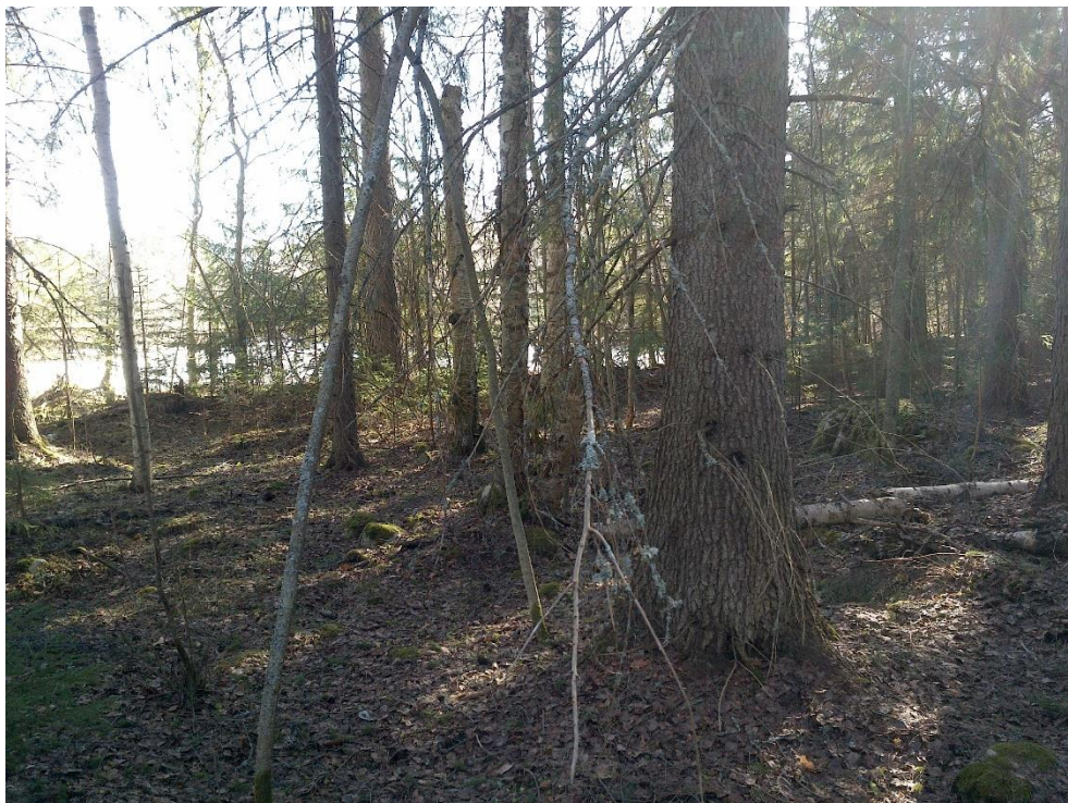
Kuva 3. Kohteen itälaidan varttuneita kuusia.