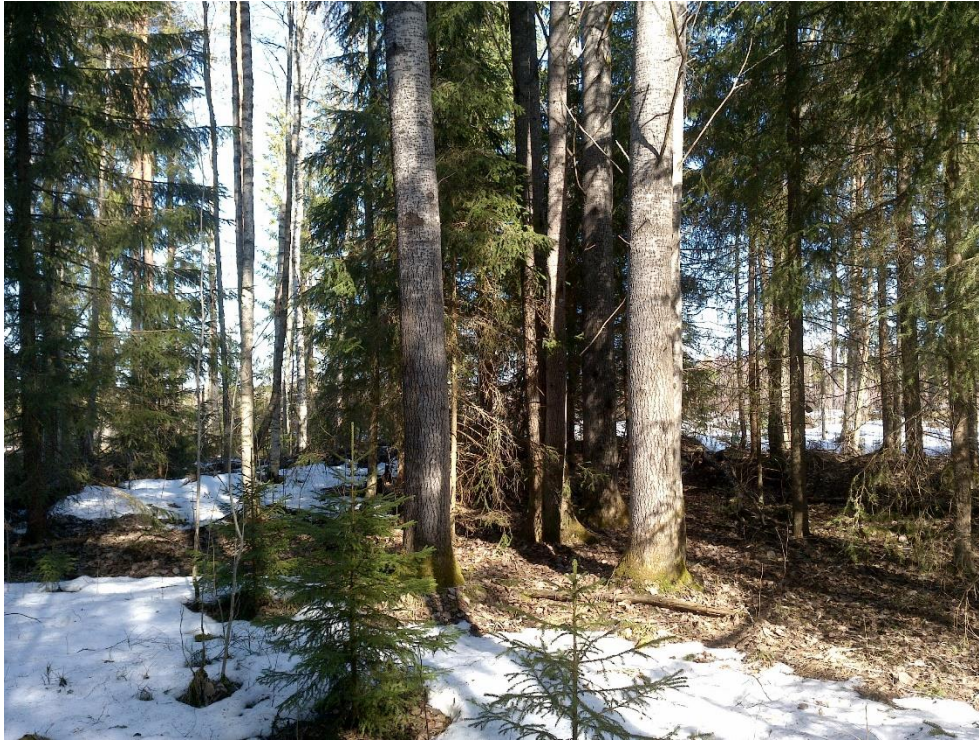
Kuva 2. Varttuneiden haapojen ryhmä kohteen koillisosassa.

melko pehmeitä koivupötkelöitä. Liito-oravalle arviolta sopivimmat alueet sijoittuvat kohteen itälaidalle.